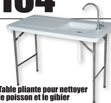
Table pliante pour nettoyer le poisson et le gibier

Comprend le robinet de l'évier de la table et le tuyau d'écoulement. 44 po x 23 po. Blanche.