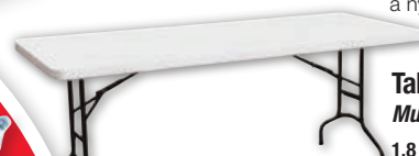
Table pliante tout-usage Multi-purpose Folding Table