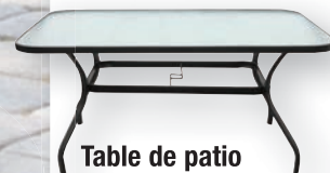
Table de patio Belvédère