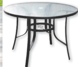
Table de patio ronde Belvédère