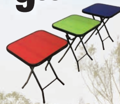
Table d'appoint pliante Folding Side Table